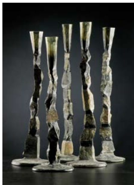
Alena Matejkova, Stone Goblets , 1995; in de mal gesmolten en geblazen grijs glas gecombineerd met basalt, gepolijst / old melted and blown gray glass combined with basalt, polished; h 76-86 cm, Ø 23-24 cm.

Sinds Plato werd de wereld als één levende schepping gezien waarna de Gnostici en de alchemisten deze visie –