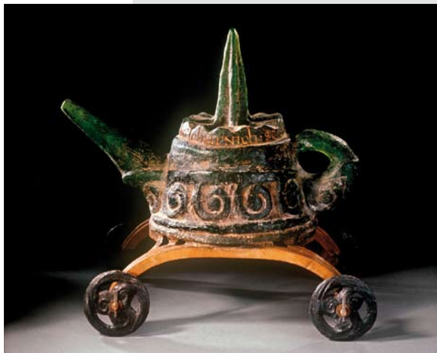
Alena Matejkova, King Ardcharnich Strólamas of Coalacrain , 1998; in de mal gesmolten glas, gepatineerd, ijzer, brons / mold melted glass, patinated, iron, bronze; 50 x 32 x 49 cm.