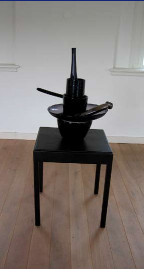
Bert van Loo, AID , 2005; diverse geblazen en handgevormde voorwerpen van glas, hout, verf / divers blown handformed glass, wood and paint; h 160 cm, b 70 cm, d 70 cm. Foto Bert van Loo