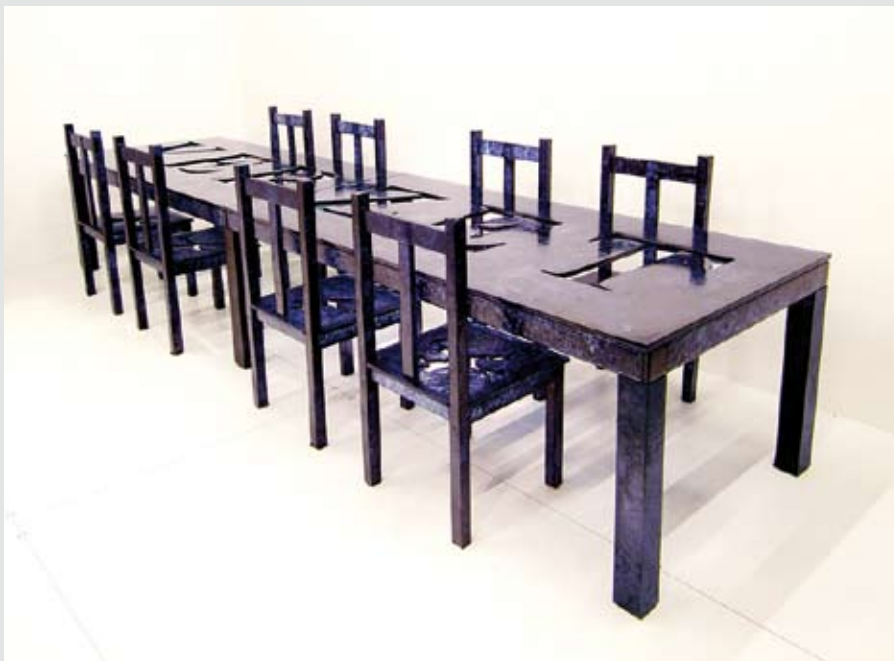
Jan Fabre, VERZET, Tafel voor de Ridders van de Wanhoop / RESISTANCE, Table for the Knights of Dispair , 2006; l 400cm, b 100 cm. Privécollectie / Private collection. All glass table and 8 chairs made in commission of D&A LAB, Brussels

the symbol representing the mystical centre, what Aristotle called "the unmoved mover", the centre of the Round Table and phi, the Chinese symbol of heaven as a circle with a central line through it, the distribution code deriving from the Divine Proportion or Golden Section. On account of the association with a stone, the grail was tied in with alchemy, the science of the concentration of vital energy and life forces. The alchemists endeavoured to find the grail, or elixir of life. All of the participating artists have been invited to realise their special designs of the Grail for this exhibition in the glass centre of the Glazen Huis.