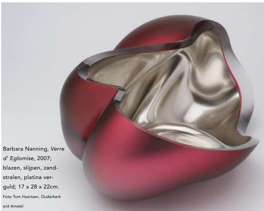
Barbara Nanning, Verre d' Eglomise , 2007; blazen, slijpen, zandstralen, platina verguld; 17 x 28 x 22cm.

zuiveringsprocessen inzetten om onge raffineerd, ruw materiaal tot een perfecte, zuivere staat te verheffen. Naast het vervaardigen van glas, verfstoffen, medicijnen en chemische stoffen zochten zij vooral hét universele oplosmiddel Alkahest , het Levenselixer, het omzetten van lood in goud en het vervaardigen van de Steen der Wijzen, zoektochten waarin theorie en praktijk versmolten.